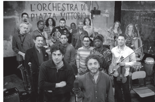
DAS ORCHESTER DER PIAZZA VITTORIO

Italien 2006, 110 Minuten, Originalfassung mit deutschen Untertiteln.